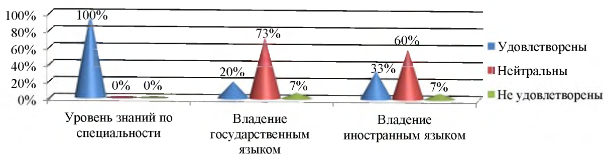
Рисунок 1 – Удовлетворённость работодателей теоретическими знаниями выпускников

Итак, средний показатель удовлетворённости теоретическими знаниями молодых специалистов составляет 51% (по итогам прошлого года опроса 48%), при среднем показателе нейтрального отношения – 44% (по итогам прошлого года 37%). Полученные результаты анкетирования указывают на то, что теоретические знания выпускников устраивают 95% работодателей (по итогам прошлого года анкетирования 85%).