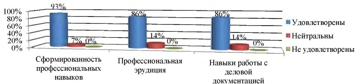
Рисунок 2 – Характеристика практической и технологической компетентности выпускников

В целом средний показатель удовлетворённости практической и технологической компетентностью молодых специалистов составляет 88%, при среднем показателе нейтрального отношения – 12% (по итогам прошлого года анкетирования 78%, при среднем показателе нейтрального отношения – 17%).